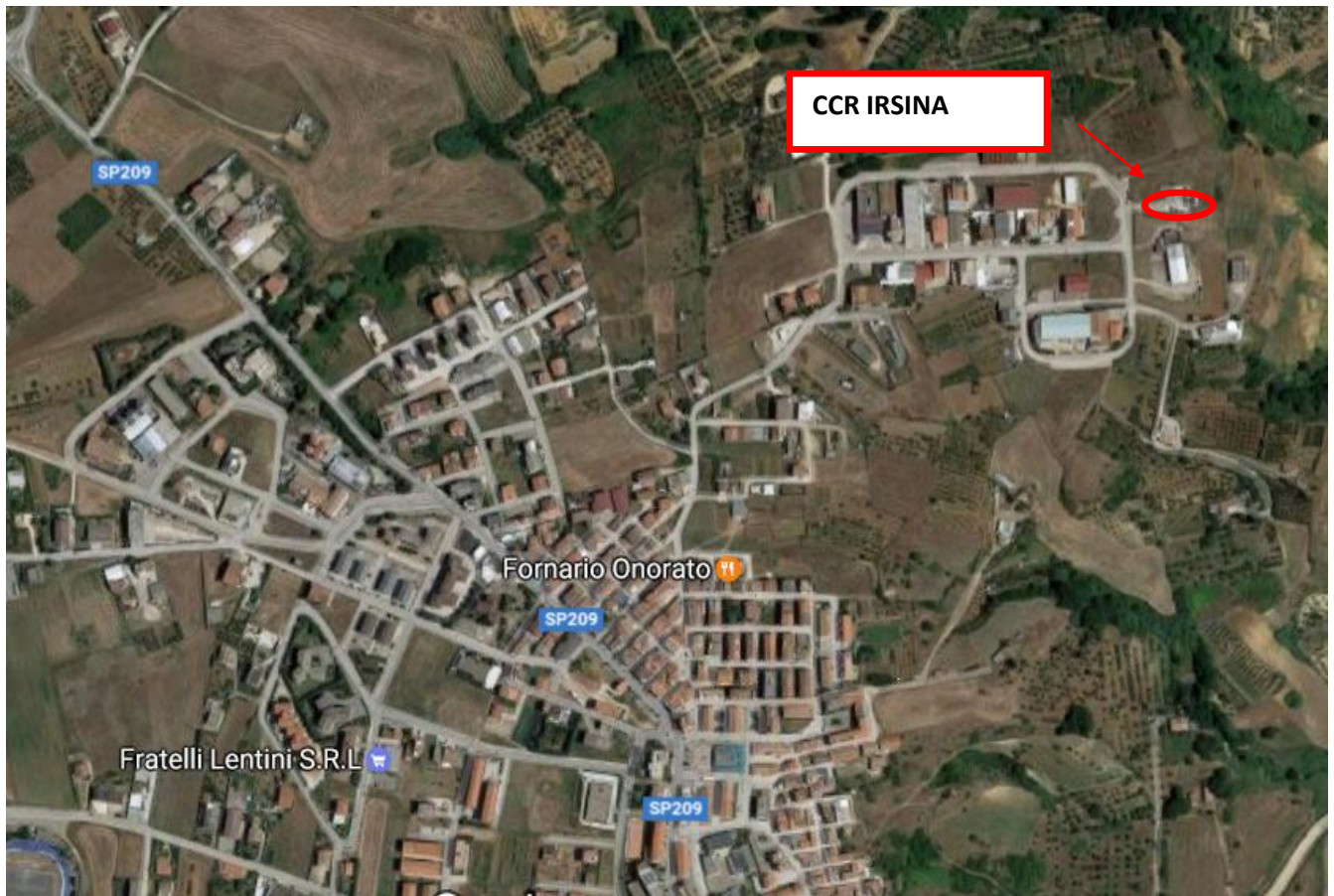
Inquadramento territoriale CCR del Comune di Irsina

Il sito individuato dove attualmente vi è il centro per la raccolta dei rifiuti solidi urbani ed assimilabili del Comune di Irsina è ubicato a ca. 900,00 m in direzione Nord – Ovest rispetto al centro abitato. Il sito in esame è allibrato al catasto terreni al fg. 41 parte di p.lla 2082.