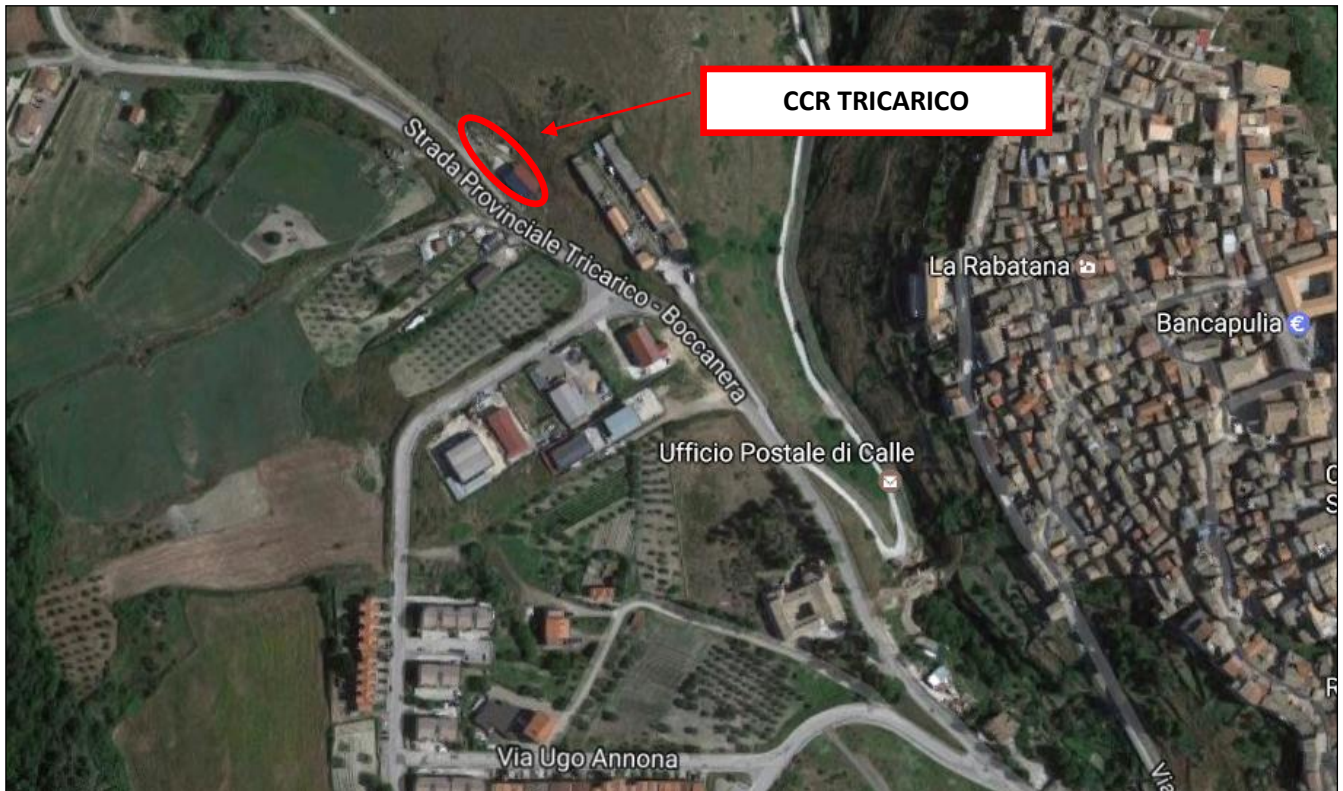
Figura 2 - Inquadramento territoriale CCR del Comune di Tricarico

Il sito individuato dove attualmente vi è il centro per la raccolta dei rifiuti solidi urbani ed assimilabili del Comune di Tricarico è ubicato a ca. 900,00m in direzione Nord – Est rispetto al centro abitato. Il sito in esame è allibrato al catasto terreni al fg. 60 parte di p.lla 1031.