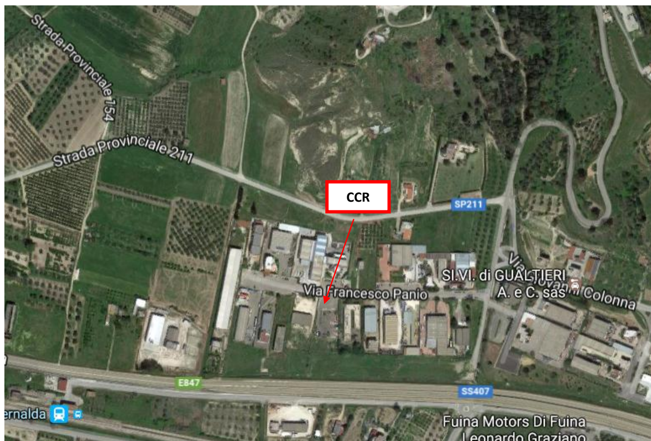
Inquadramento territoriale CCR del Comune di Bernalda

Il sito individuato dove attualmente vi è il centro per la raccolta dei rifiuti solidi urbani ed assimilabili del Comune di Bernalda è ubicato a ca. 1,30km in direzione Sud rispetto al centro abitato. Il sito in esame è allibrato al catasto terreni al fg. 20 p.la 1398.