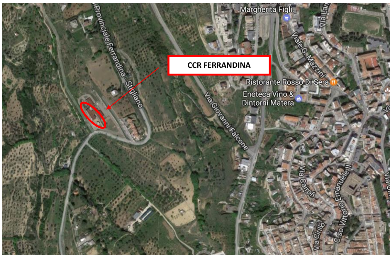
Inquadramento territoriale CCR del Comune di Ferrandina

Il sito individuato dove attualmente vi è il centro per la raccolta dei rifiuti solidi urbani ed assimilabili del Comune di Ferrandina è ubicato a ca. 700,00m in direzione Ovest rispetto al centro abitato.