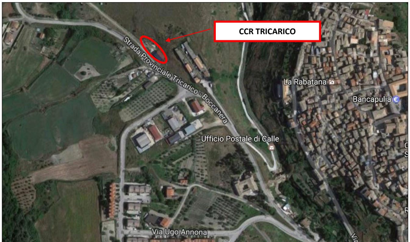
Figura 2 - Inquadramento territoriale CCR del Comune di Tricarico

Il sito individuato dove attualmente vi è il centro per la raccolta dei rifiuti solidi urbani ed assimilabili del Comune di Tricarico è ubicato a ca. 900,00m in direzione Nord – Est rispetto al centro abitato. Il sito in esame è allibrato al catasto terreni al fg. 60 parte di p.lla 1031.