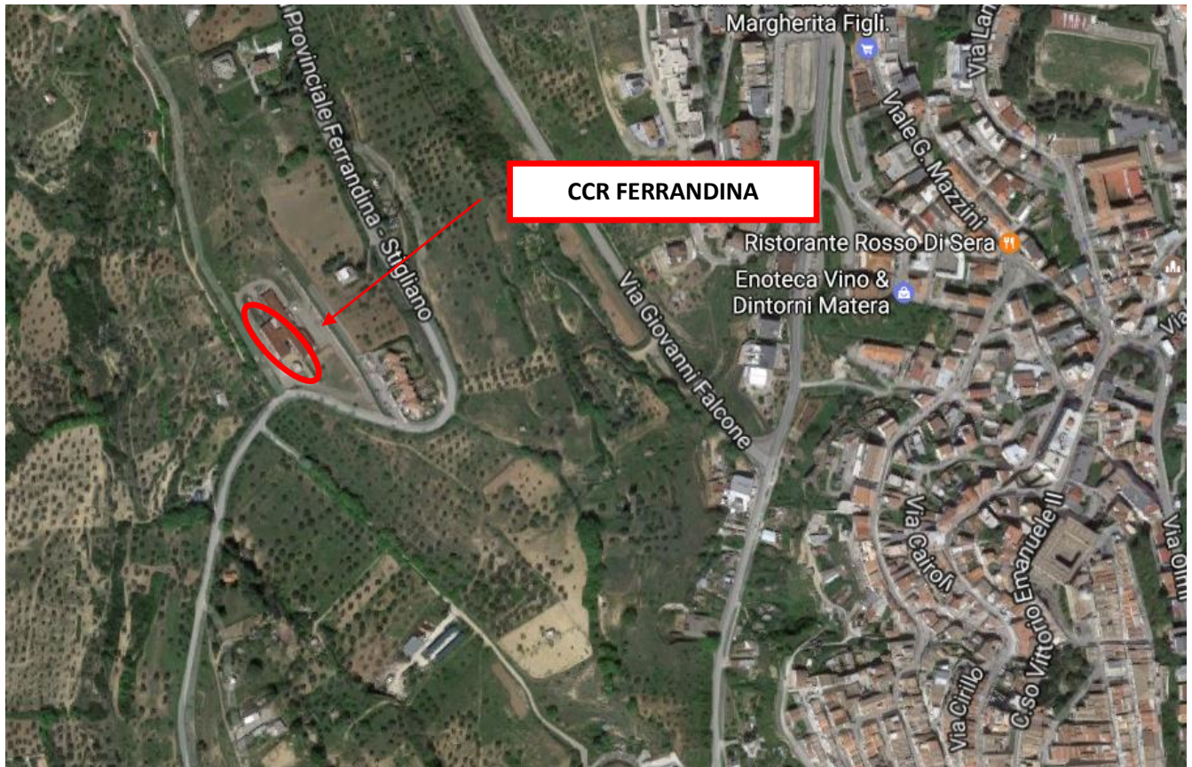
Inquadramento territoriale CCR del Comune di Ferrandina

Il sito individuato dove attualmente vi è il centro per la raccolta dei rifiuti solidi urbani ed assimilabili del Comune di Ferrandina è ubicato a ca. 700,00m in direzione Ovest rispetto al centro abitato.