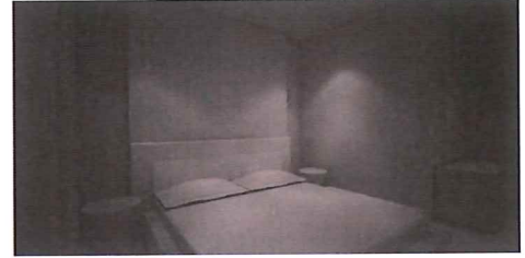
Progetto per un appartamento in Via Caduti di Nassirya 187